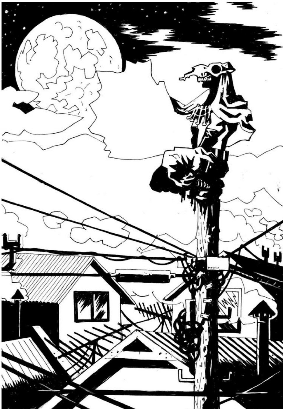
(Omar Hirsig - Guanaco blanco , fragmento)