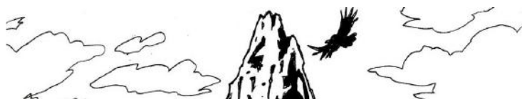
(Omar Hirsig - Yo soy la isla, fragmento)

En suma, en el corpus analizado se pudo observar el funcionamiento del narrador-cámara que no sólo realiza capturas fotográficas de la cotidianidad, sino que utiliza, también, los procedimientos propios de este arte: la focalización y los planos. Además, al mismo tiempo que las fotografías y el lenguaje funcionan como marco, también sirven como disparadores hacia lo que queda por fuera del cuadro de foco, de aquello no dicho, dándole al lector un rol activo en donde tiene que reponer e interpretar el relato invisible: un Microfilm a contraluz de la Patagonia.