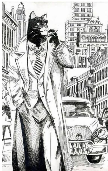
(Díaz Canales y Guarnido - Blacksad )

“Infierno Grande” de Guillermo Martínez, cuento publicado en el año 1989. La elección de este cuento se encuentra mediada por el interés de generar en el alumno el sentido que en el texto conlleva el recurso de la intertextualidad y conocer o poner en discusión un tema que atraviesa a la Argentina como país.