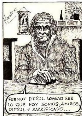
(Chelo Candia - El sistema , fragmento)

En primer lugar, la viñeta con la que se inicia la historieta nos presenta un hombre viejo, que narra desde un futuro incierto una situación fantástica, situada en la realidad cotidiana de Allen, apelando al procedimiento narrativo del flashback . Este comienzo la relaciona, en un transparente ejercicio de intertextualidad, con la obra fundadora de la ‘edad de oro’ de la historieta argentina: El Eternauta (1957), de Héctor Germán Oesterheld y Francisco Solano López, puesto que ambas historias se inician de la misma manera. Con “La muralla”, Candia pone en juego tanto la construcción de una ficción centrada en la cotidianeidad de sus lectores como la referencia —y reescritura— a la obra cumbre de la historieta nacional. Así como en El Eternauta , unos visitantes inesperados y desconocidos colocan a toda la comunidad bajo amenaza, en este caso mediante un invisible muro que rodea Allen. Sin embargo —y aquí es donde Candia se distingue y se distancia de la gesta fundacional de Oesterheld y Solano López—, en una estrategia distintiva de la ciencia ficción que apela a la circularidad del tiempo y a la teoría de