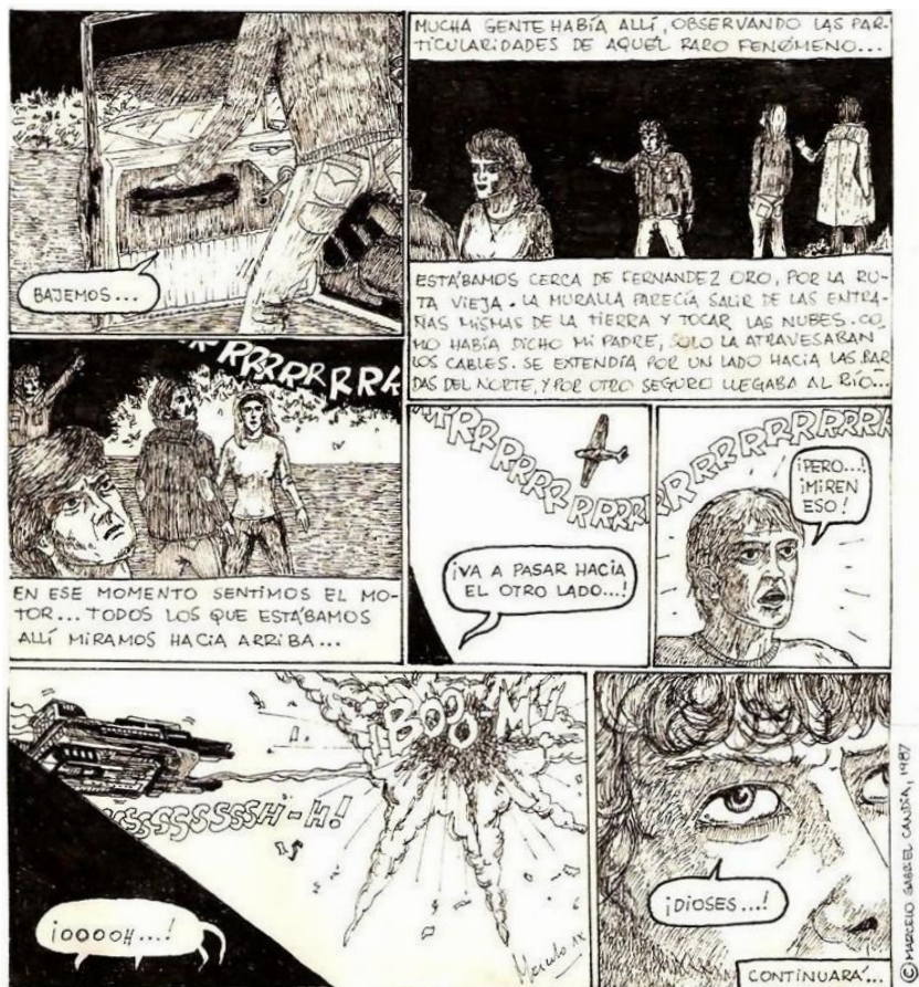
(CheLo Candia - El sistema , fragmento)

Con la aparición de los diversos números de El Sistema , los temas actuales y locales se siguieron profundizando. Las historietas de Candia no sólo desarrollaron temáticas de corte fantástico-épico, como “La muralla” o “Cartas a Osiris” —que comenzó en el nº 4—, sino también de temática crítico-satírica, como “Forrocop” —nº 9 y siguientes— y la recordada “The Incautator” 3 —del nº 21—, o bien de carácter social-combativo, y que anticiparían sus trabajos posteriores, como “Ruta 22” —en el nº 16.