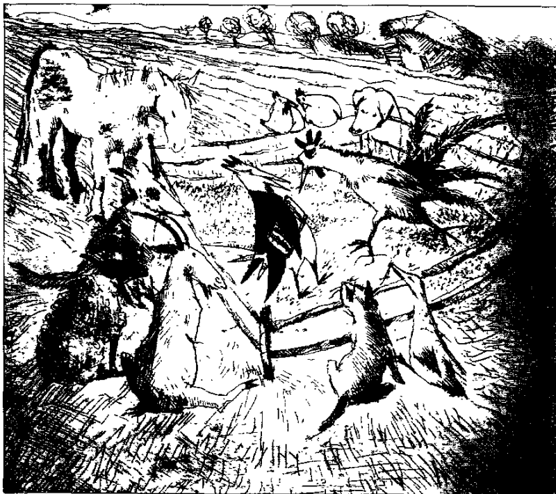
CAMILLE HENRIOT, SIN TÍTULO, BOLOGNA ANNUALE '99

plea?, ¿cómo son los personajes?, ¿qué espacio y qué elementos lingüísticos lo describen?, ¿qué mundos posibles se proponen?, ¿qué lenguaje se utiliza?, ¿qué ideología o punto de vista se propone y de qué manera?